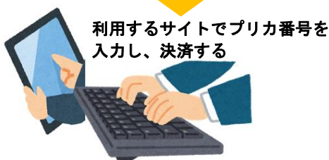
利用するサイトでプリカ番号を入力し、決済する