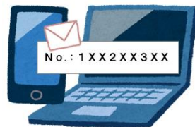
WEBで購入 (メールでプリカ番号が通知される)