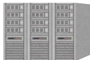
発行者のサーバで残高を管理