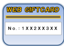
コンビニ等でカードを購入