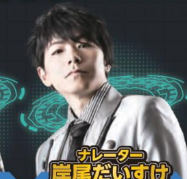
ナレーター 岸尾だいすけ

詳しくは特設WEBサイトをチェック! ▶ https://joqr.co.jp/cmaward/