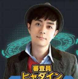
審査員 ヒヤダイン