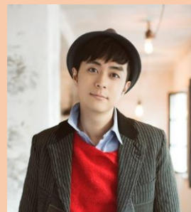
ヒヤダイン (音楽クリエイター)