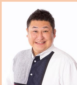
オテンキノり (お笑い芸人)