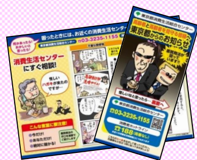
※配布するリーフレット