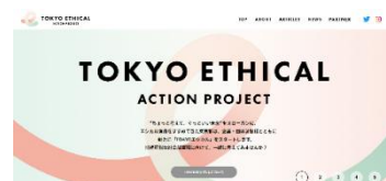
<専用サイトイメージ>

マイエシカル初回は、池崎大輔選手(パラアスリート・東京 2020 パラリンピック車いすラグビー銅メダリスト)を紹介します。