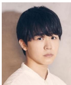
すずき りき 鈴木 福 (俳優)

本プロジェクトやエシカル消費の機運を醸成いただく アンバサダー を決定しました。