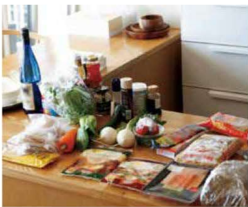
サルベージ・パーティに持ち寄られた食材

近年注目されているキーワードとして「フードサルベージ（食材を救済）」という考え方があります。つ