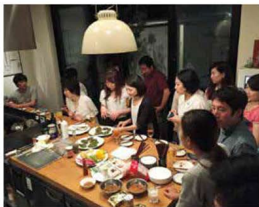
サルベージ・パーティの様子

仲の良い友達同士で、こうした食材を持ち寄って、「サルベージ・パーティ」をすれば、新たな発見や楽しい時間を過ごすことができるのではないのでしょうか。