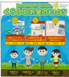
Web版消費者教育読本 (3つのステージ)