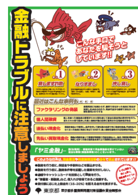
【啓発リーフレット】