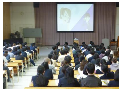
【都立高校での出前講座】