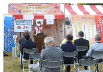
【金融トラブル防止セミナーの様子】