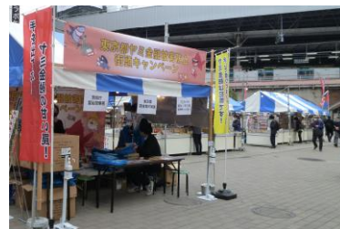
【新橋駅前SL広場会場】