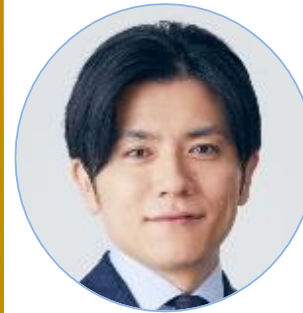
青木源太 (フリーアナウンサー)