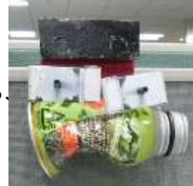
変形したアルミ缶

※(独)国民生活センター「ジャンプ式や自動開閉式折りたたみ傘の事故—重い後遺症が残るケースも—」に準じて実施しました。