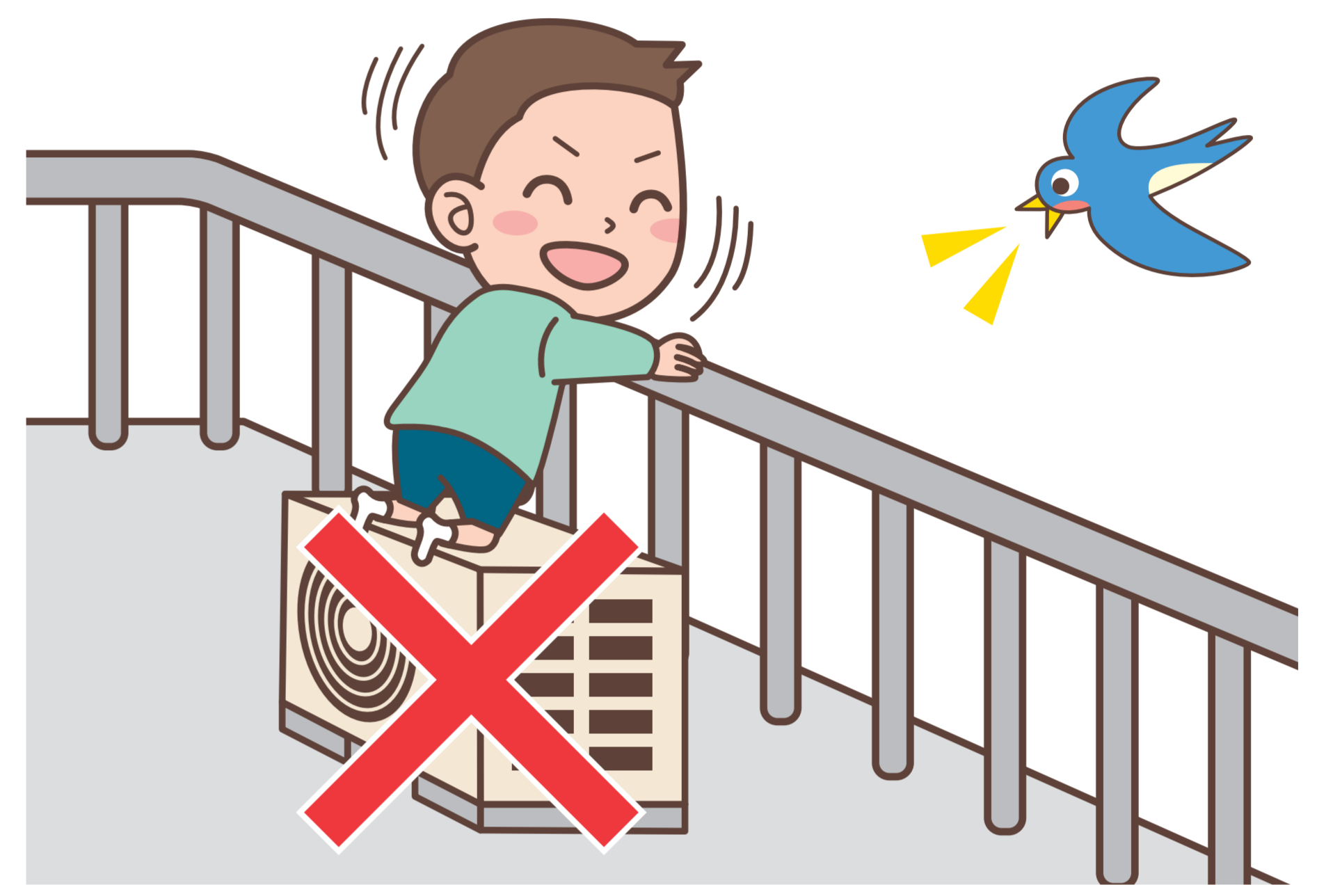
足がかりになるものを置かない