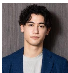
国山 ハセキ (プロデューサー/タレント)