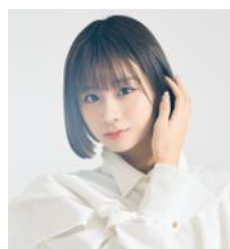
金子 みゆ (アイドル/タレント)