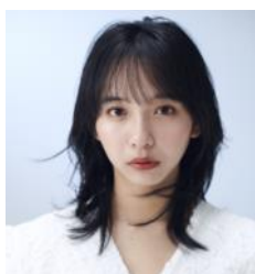
山之内 すず (タレント・女優)