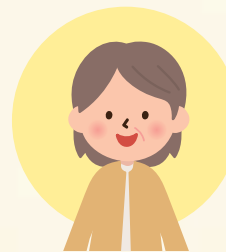
チカダ トモコ 近田 友子 おせっかいやきの 近所の主婦