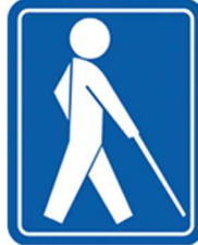
【盲人のための国際シンボルマーク】 所管：社会福祉法人日本盲人福祉委員会