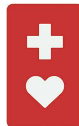
【ヘルプマーク】 所管：東京都